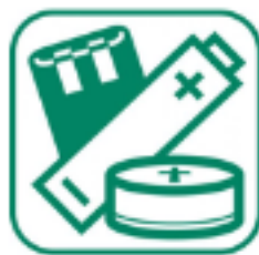
PILES ET ACCUMULATEURS