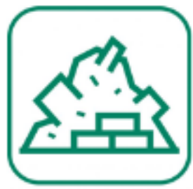
DÉBLAIS / GRAVATS