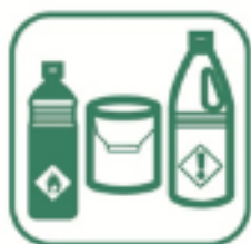
DÉCHETS DIFFUS SPECIFIQUES (DDS)