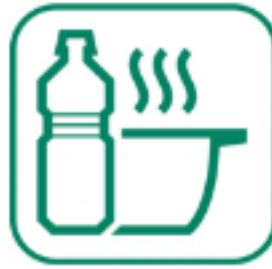
HUILES DE FRITURES