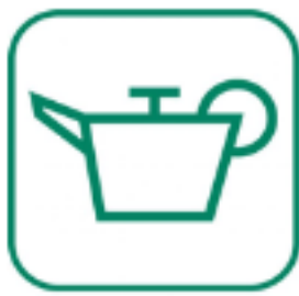
HUILES DE VIDANGE